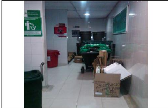
Foto 1. Sitio de almacenamiento central