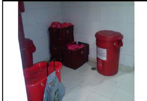
Foto 2. Área de almacenamiento de residuos con riesgo biológico