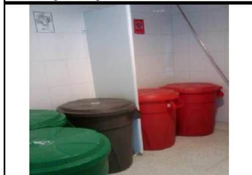
Foto 4. Sitio de almacenamiento intermedio